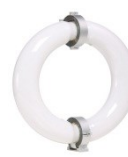
blendfreie Ringröhre nur 20% Lichtverlust nach 80.000h